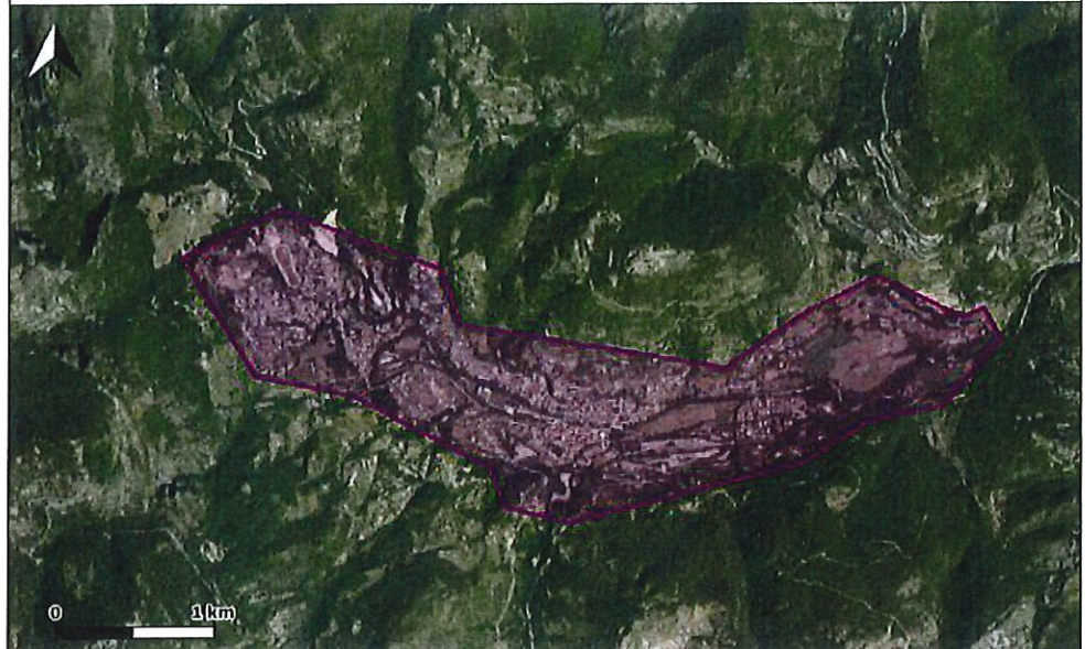
Périmètre prévisionnel du plan guide